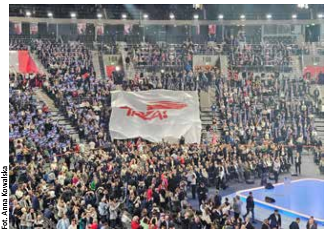
Autorem grafiki jest Jerzy Janiszewski- autor znaku graficznego Solidarności z 1980 roku

jednocześnie wskazując na potrzebę rozwoju zarówno w dużych miastach, jak i na obszarach wiejskich. Nie przedstawił jeszcze szczegółowego programu wyborczego, jednak padło już kilka deklaracji, m.in. podpisanie uznającą język śląski za język regionalny. Jak mówił: "To jest symbol tego, że poprzednia władza była pełna nieufności i zawsze szuka wroga wewnętrznego, szuka genu polskości, a my chcemy wspólnoty, żeby te wszyst-