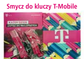
Smycz do kluczy T-Mobile Zeszyt i notatnik T-Mobile