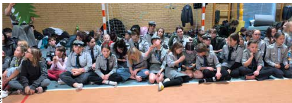
Rajd w Bisztynku to nie tylko czas wytężonej pracy, ale także niezapomniane chwile