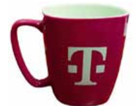
Kubek firmowy T-Mobile

W emocjonującej atmosferze, w Gliwicach, odbyła się Konwencja Koalicji Obywatelskiej, na której ogłoszono kandydaturę Rafała Trzaskowskiego na prezydenta Polski. Wzięła w niej udział spora delegacja członków KO z Bartoszyca i Lidzbarka Warmińskiego. Obecny prezydent Warszawy, zdobył 74,75 proc. głosów w wewnętrznych prawyborach i zyskał pełne poparcie partii, w tym Platformy Obywatelskiej, Nowoczesnej i Zielonych.