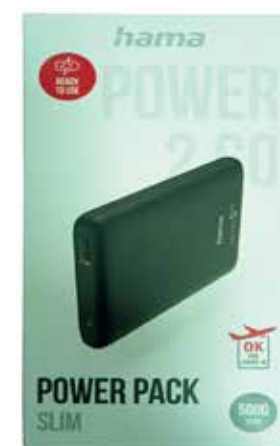
Powerbank HAMA 5000mAh