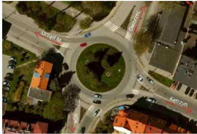
Brak oznakowania poziomego na rondzie

Nie możemy więc uznać Ronda Solidarności