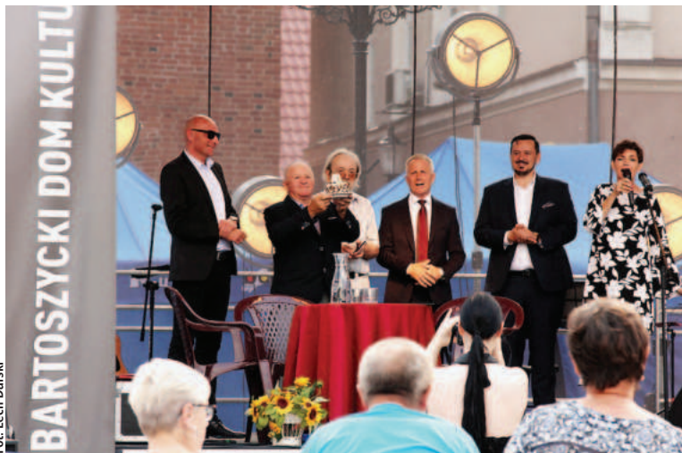
Nie zabrakło tradycyjnego 100 lat...