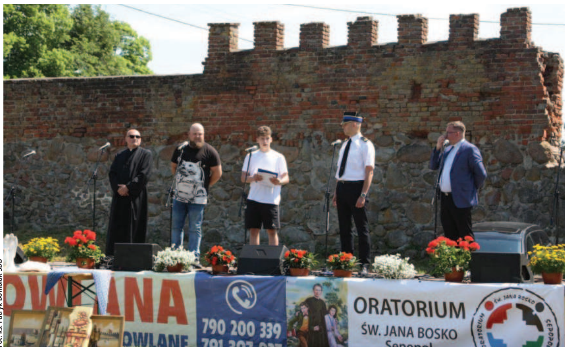
Pod koniec maja odbył się Festyn Rodzinny pod hasłem „Razem Walczymy o Każde Życie” organizowany przez Oratorium św. Jana Bosko