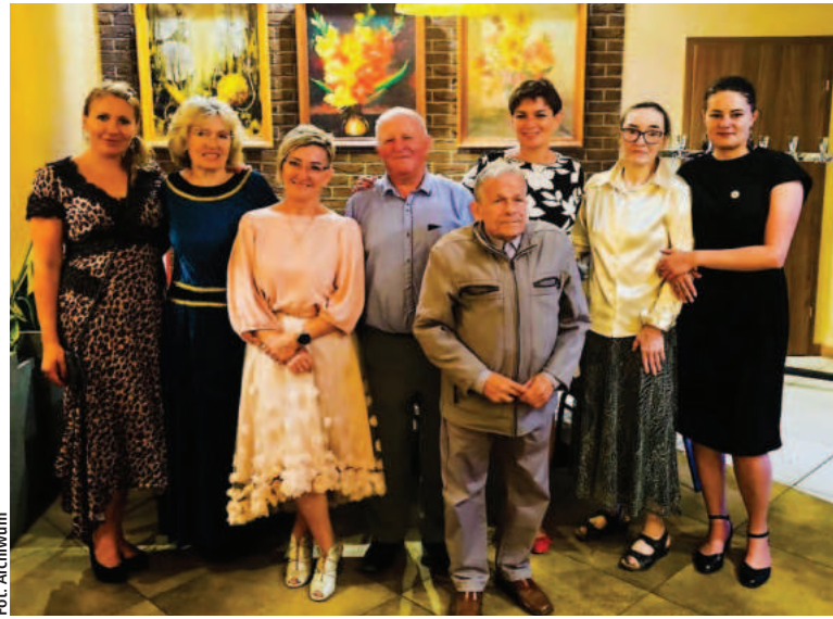
Pamiątkowe zdjęcie bartoszyckich poetów