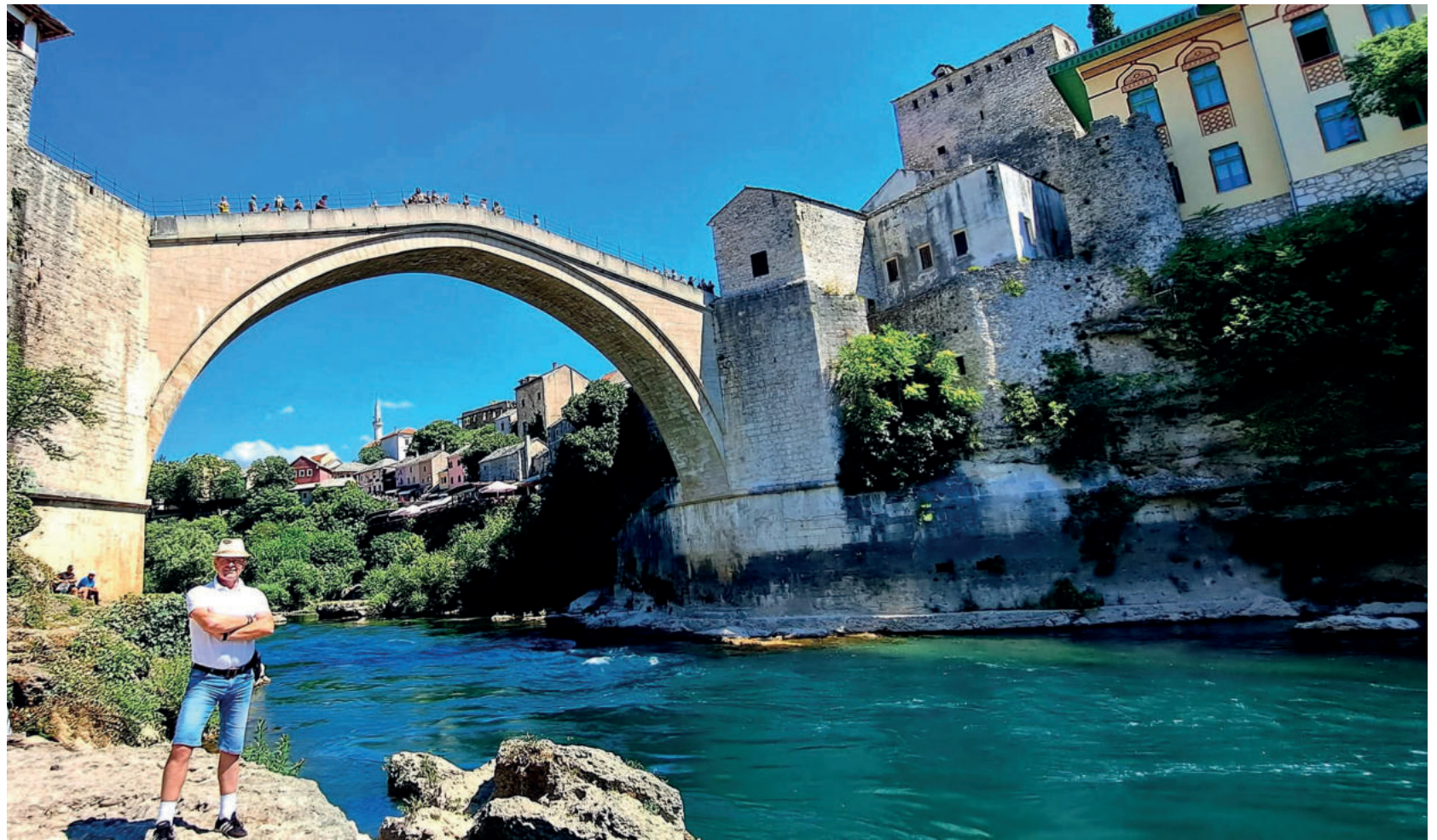
Mostar - Stary Most nad Neretwą

W 1566 r., na polecenie Sulejmana Wspaniałego, powstał kamienny Stary Most, który do dziś pozostaje najważniejszym zabytkiem Mostaru. Niestety, w czasie wojny, 9 listopada 1993 r., most został zburzony przez Chorwatów. Jego żmudną odbudowę zakończono 23 lipca 2004 r. Co ważne, dokonano jej w stu procentach z tych samych kamieni, z których powstał pierwotnie, wydobytych uprzednio z dna