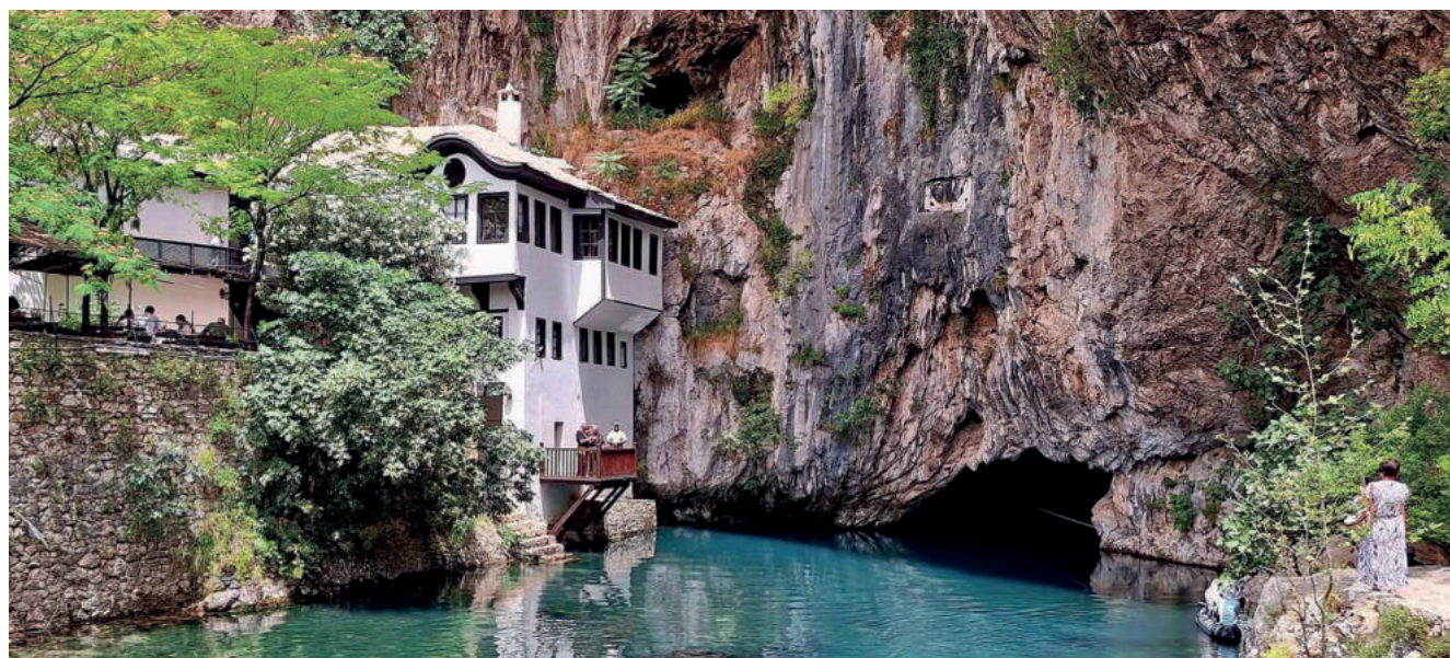
Klasztor Derwiszów i wywierzyisko rzeki Buni

jeden z największych poetów i mistyków perskiego kręgu kulturowego. Bośniacka nazwa klasztoru to Błagaj Tekija. Klasztor funkcjonował do śmierci ostatniego szejka w 1925 r. Warto wspomnieć, że w Błagaj urodziła się w XV w. ostatnia królowa Bośni