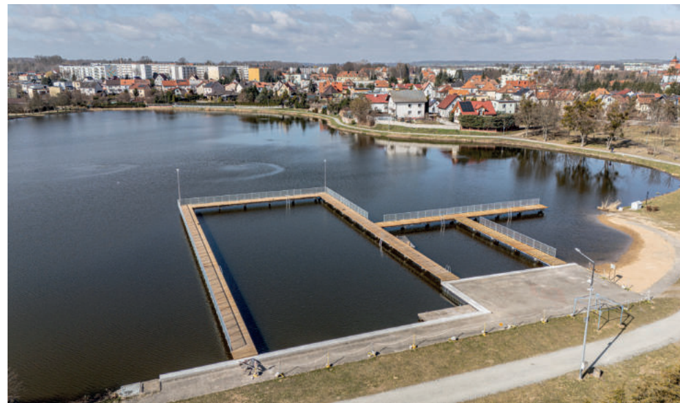
Przebudowa pomostów na jeziorze „mleczarskim” powoli zbliża się do końca

Formularze zgłoszeniowe, regulamin oraz harmonogram Bartoszyckiego Budżetu Obywatelskiego 2026 dostępne są na stronach Bartoszyce.pl oraz bbo.bartoszyce.pl .