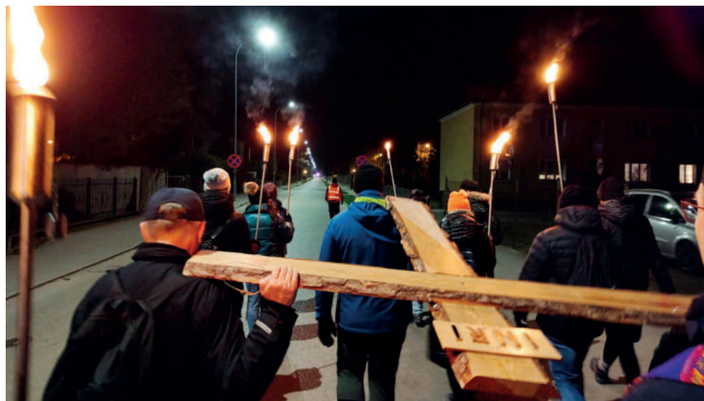
W ciszy i skupieniu ponad stu uczestników V Terenowej Drogi Krzyżowej w Bartoszczy pokonała nocną trasę, zamieniając fizyczny trud w okazję do głębokiej, wewnętrznej przemiany