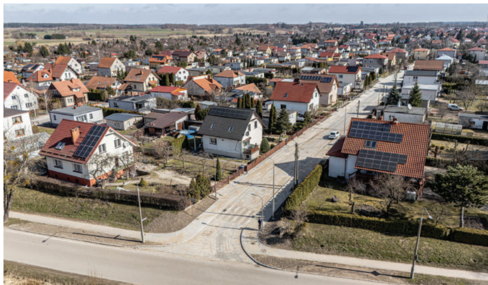
Kolejne ulice na „Działkach” zyskują nowe nawierzchnie. Na zdjęciu ul. Spółdzielców

Nadejście wiosny to nie tylko zasłużone wytchnienie po wyjątkowo mroźnej zimie, ale przede wszystkim zielone światło dla lokalnych placów budowy. Coraz dłuższe i cieplejsze dni pozwalają na pełne wznowienie prac przy kluczowych inwestycjach miejskich. Niektóre z nich wchodzi właśnie w fazę finałową, podczas gdy inne dopiero zaczynają zmieniać krajobraz miasta.