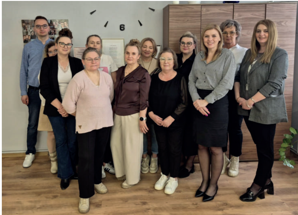
Zespół Miejskiego Centrum Usług Społecznych w Górowie Iławeckim wraz. To oni na co dzień dbają o to, by wsparcie docierało do każdego potrzebującego mieszkańca w sposób profesjonalny i życzliwy