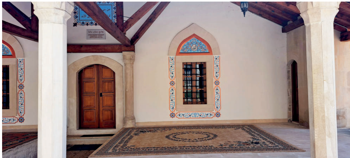
Wejście do meczetu Koski-Mehmed-Pashy