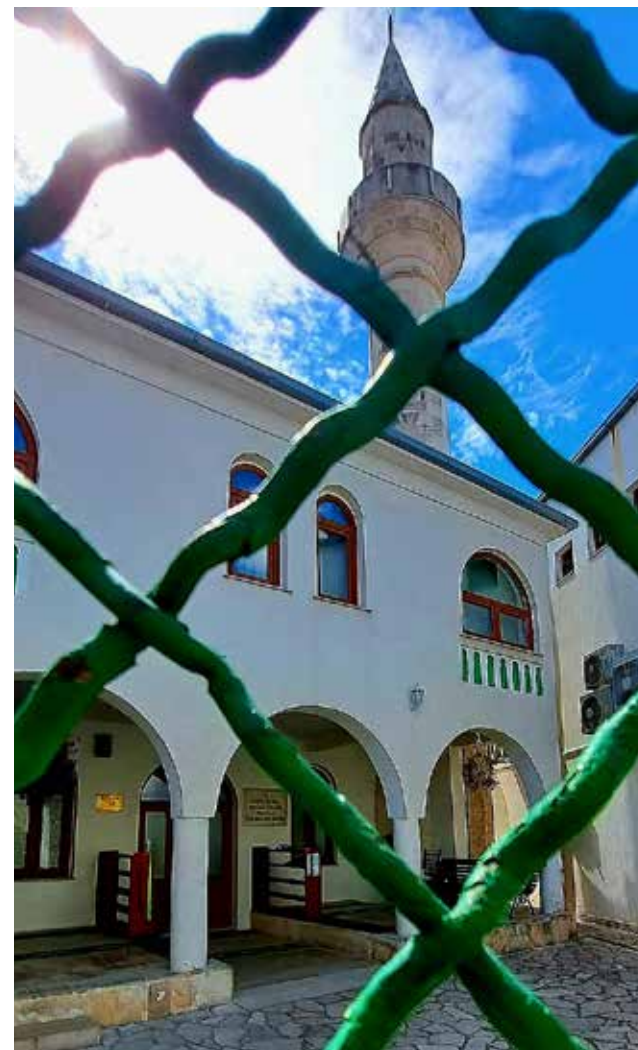
— Meczet Koski Mehmed-Paszy...