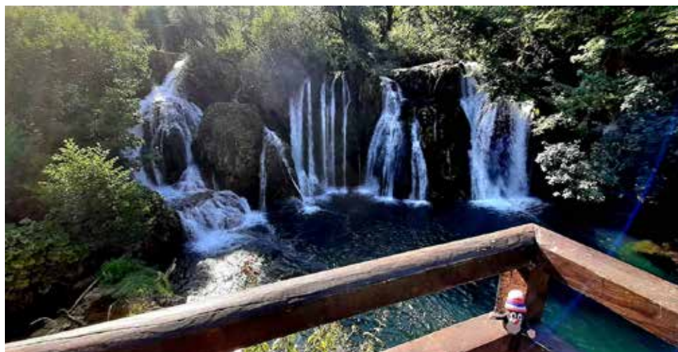
— Wodospady w Marjańskim Brodzie...

w Dayton. Na jego mocy kraj został podzielony na dwie części składowe: Federację Bośni i Hercegowiny, zamieszkaną głównie przez Bośniaków i Chorwatów, oraz Republikę Serbską, której dominującą grupą etniczną są Serbowie.