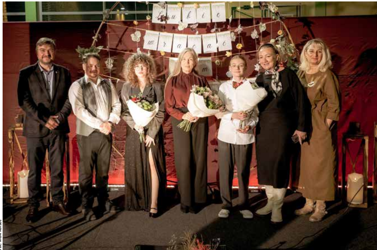
Wykonawcy koncertu „Lubię wracać tam, gdzie byłem” wraz z organizatorami wydarzenia podczas spotkania w Gminnym Ośrodku Kultury w Barcianach