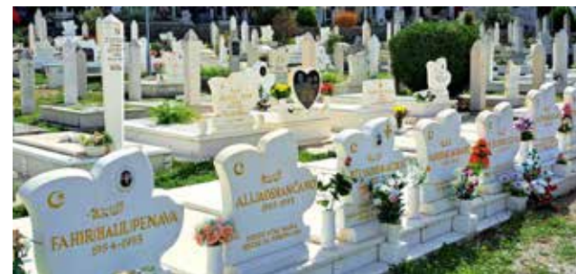
— Polegli za Bośnię...

Wojna trwała do grudnia 1995 r., kiedy podpisano porozumienie pokojowe