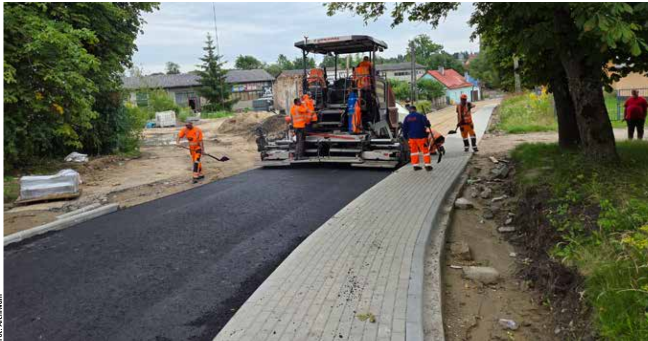
- Setki wykonanych odcinków, całe pakiety ulic, nowe nawierzchnie, chodniki, oświetlenie i odwodnienia

Od 2018 do 2025 roku w Górowie Iławeckim zaszły zmiany, które trudno przeczyć. Kilometry nowych nawierzchni dróg, chodniki, oświetlenie i odwodnienia sprawiły, że miasto „oddycha” inaczej. To inwestycyjny skok, wart blisko 30 milionów złotych. Co ważne większość środków pochodzi z funduszy zewnętrznych, przy dofinansowaniu 95–98 proc. Dzięki temu miasto mogło prowadzić wiele projektów jednocześnie, bez nadmiernego obciążania budżetu lokalnego.