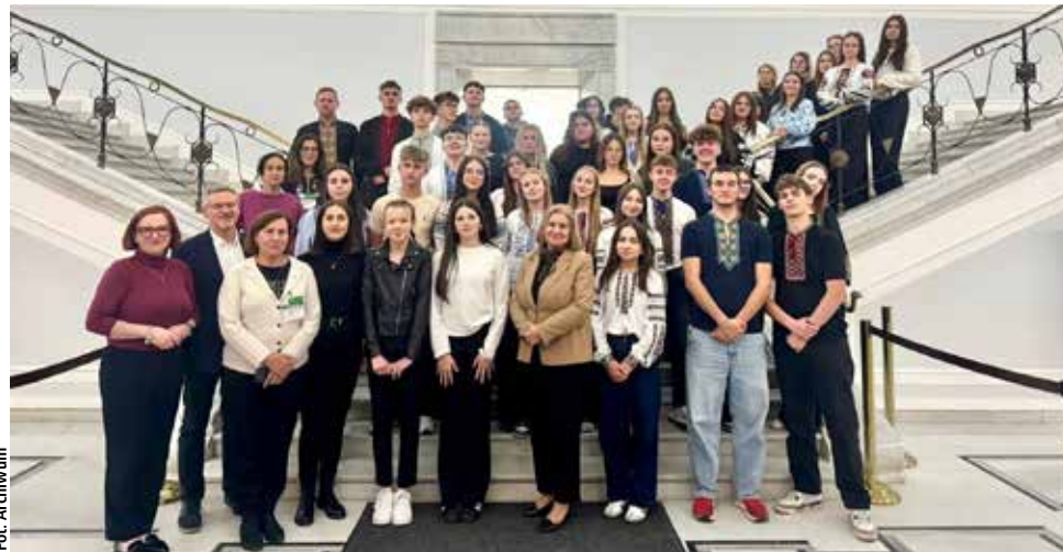
Młodzieżowa Rada Miasta i samorządy uczniowskie w Sejmie RP podczas edukacyjnej wizyty

Młodzieżowa Rada Miasta oraz samorządy uczniowskie Zespołu Szkół w Górowie Iławeckim, Zespołu Szkół z Ukraińskim Językiem Nauczania oraz Szkoły Podstawowej w Górowie Iławeckim uczestniczyły w wycieczce edukacyjnej do Sejmu RP. Wizyta była okazją do bliższego poznania instytucji państwowych oraz pracy parlamentarzystów.