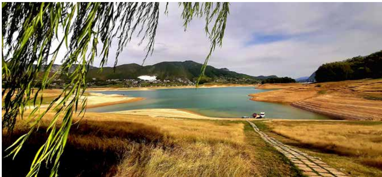
— Jezioro Ramskie...

Svetog Save”, czyli „Książę św. Sawy”, patrona Serbii i Bałkanów. I od tego tytułu zaczęto nazywać te tereny Hercegowiną. Wcześniej te ziemie nie miały tak określonej nazwy jako osobny byt – dopiero jego ambicje oraz prestiżowy tytuł stworzyły to określenie. Stjepanek po prostu zrobił sobie brand, jak influencer średniowiecza.