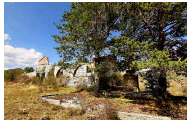
— Pozostałości po wojnie...