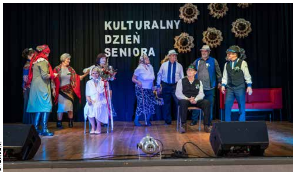
Kulturalny Dzień Seniora przyciągnął do Korsze wielu seniorów z powiatu kętrzyńskiego

Na scenie wystąpiła grupa Młoda Sercem z Kętrzyńskiego Centrum Spotkań Seniora, prezentując spektakl „Kawałki żeńskie, męskie i nijakie”. Aktorzy-ama-